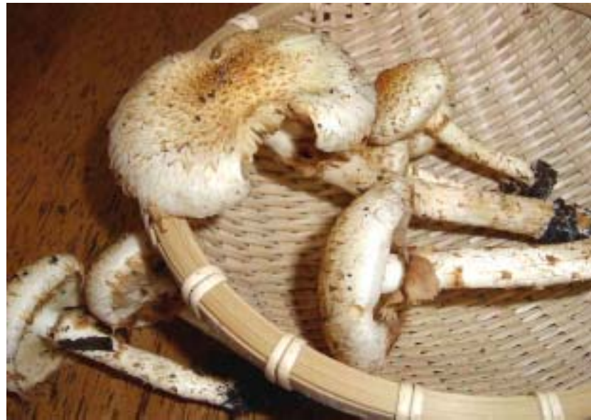
スギの大木に生えていたスギタケモドキ

スギ林には、秋のはじめ頃、古株にスギヒラタケが層になってびっしり生えていることがある。この辺ではあまり歓迎されないが、セケ宿や山形地方では貴重な食菌として利用されている。時にはオシロイシメジなども列をなしている。思わぬ収穫にありつけることがある。今はスギエダタケが白い点々のように林全体に散在している。場所によってはクリタケなどもとれることがある。